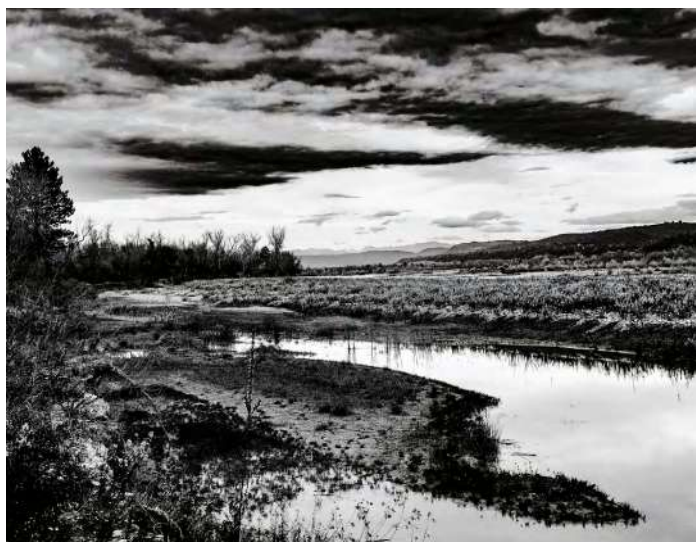
Henri Kartmann "La Durance, voyage imaginaire" Salle de la Frache