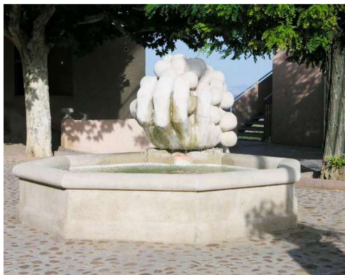
Louis Plantier "Fontaines festives" Salle de la Frache