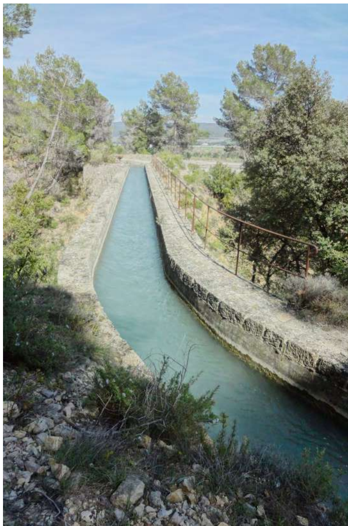
Société du Canal de Manosque "Le canal qui a changé le visage du territoire" Salle de la Frache